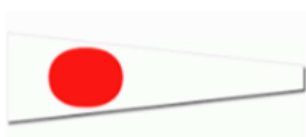
(Witte wimpel met rode stip)